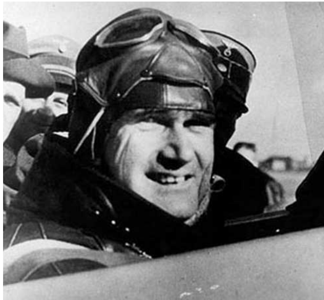
Der Friedensflieger Rudolf Hess

So musste Rudolf Hess erkennen, dass die englische Regierung keine Friedensverhandlungen wünschte. Der europäische Krieg weitete sich zum Weltkrieg aus.